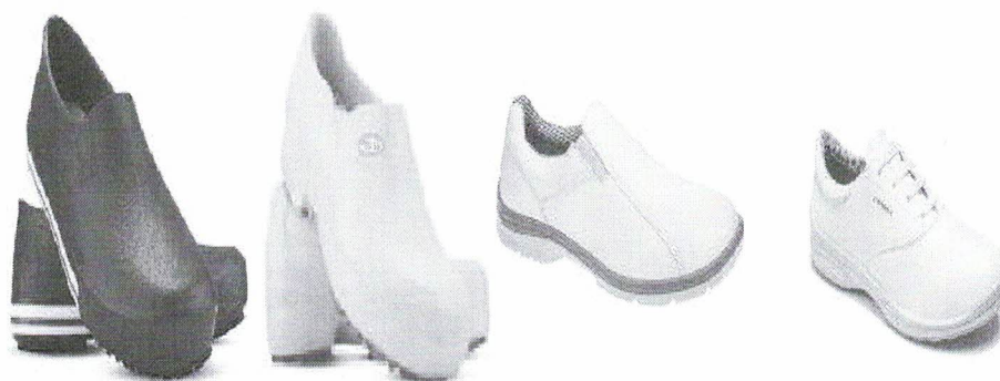
Exemplos de calçados de segurança